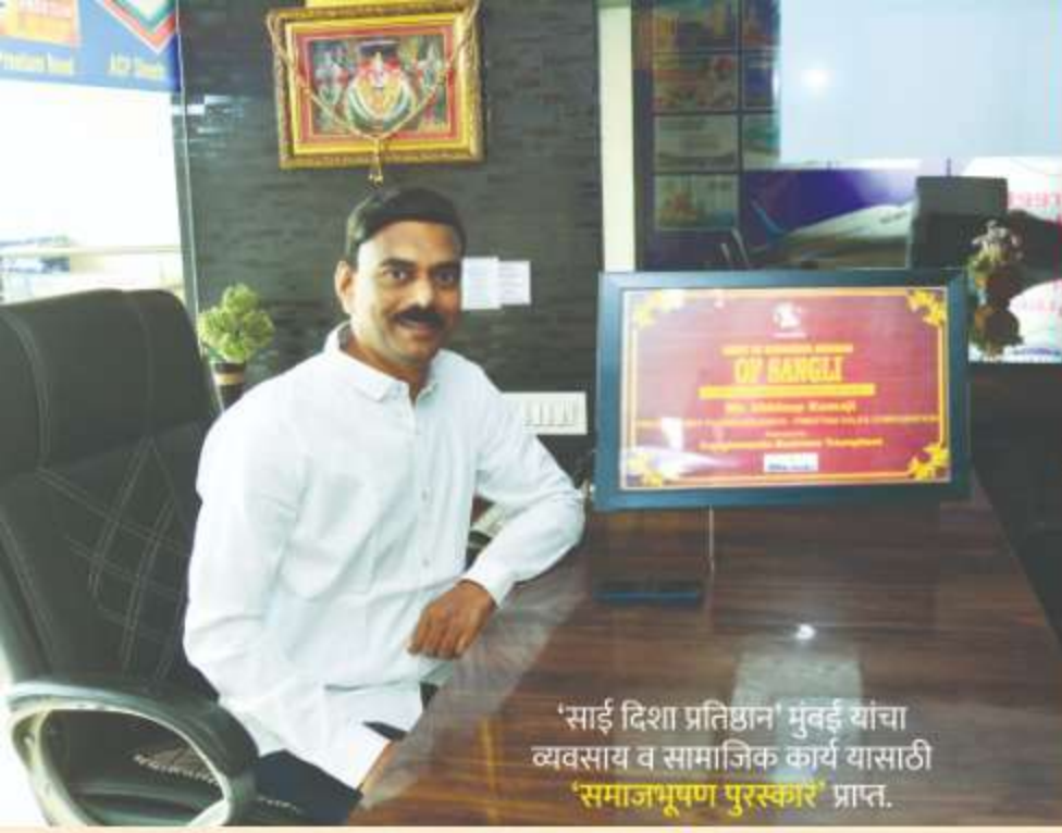
'साई दिशा प्रतिष्ठान' मुंबई यांचा व्यवसाय व सामाजिक कार्य यासाठी 'समाजभूषण पुरस्कार' प्राप्त.